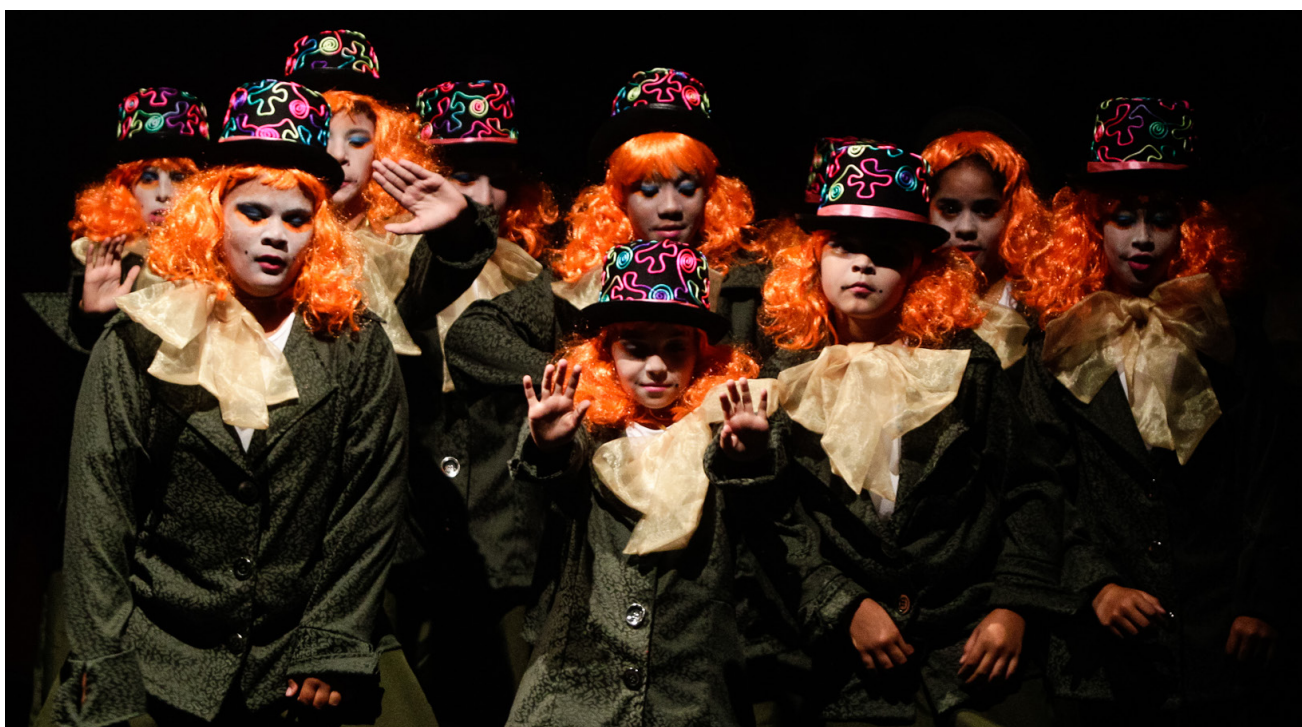
Imagens da apresentação das crianças em Dezembro no teatro Iguatemi Campinas

Casa de Maria de Nazaré – Unidade III Casa Hosana