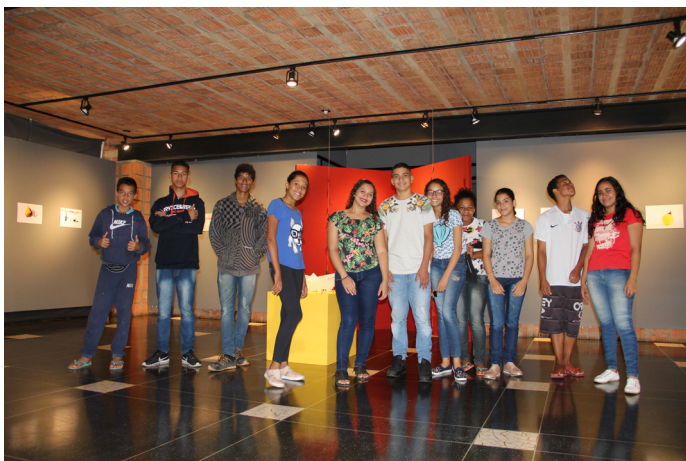
Grupo de adolescentes do Progen visitam exposição na Casa do Lago na Unicamp.