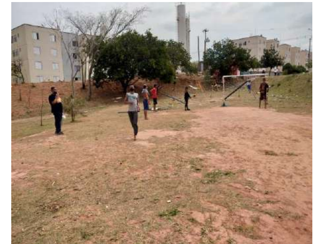
Adolescentes em atividades presenciais